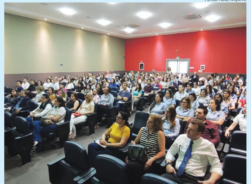
A capacitação do empresário é uma das responsabilidades da ACIL, que realiza cursos e palestras ao longo de todo o ano

É assim que a ACIL almeja fazer a diferença para seus associados. Com a conduta de quem quer ver Limeira crescer, o empresário prosperar e a comunidade se beneficiar. São essas e tantas outras ações que estabelecem a força da união entre a Associação e as classes que representa. É por isso que a ACIL luta pelo crescimento de cada associado, sendo esta uma causa pela qual a Associação Comercial e Industrial de Limeira continuará trabalhando por muitos anos.