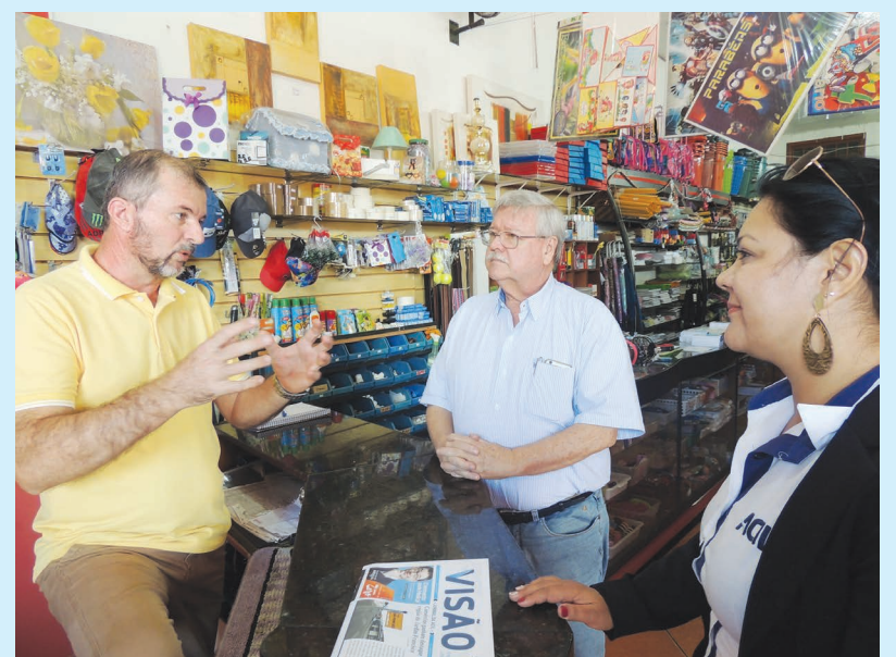
A Associação também se mantém próxima ao empresário, ouvindo suas reivindicações, sugestões e críticas