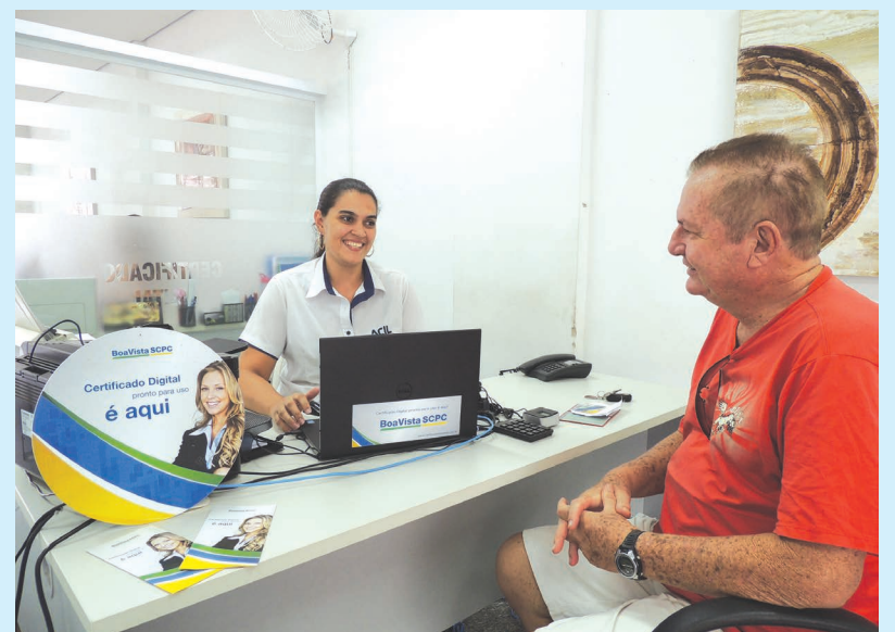
Os associados da ACIL têm à disposição vários serviços que os auxiliam na gestão de seus negócios