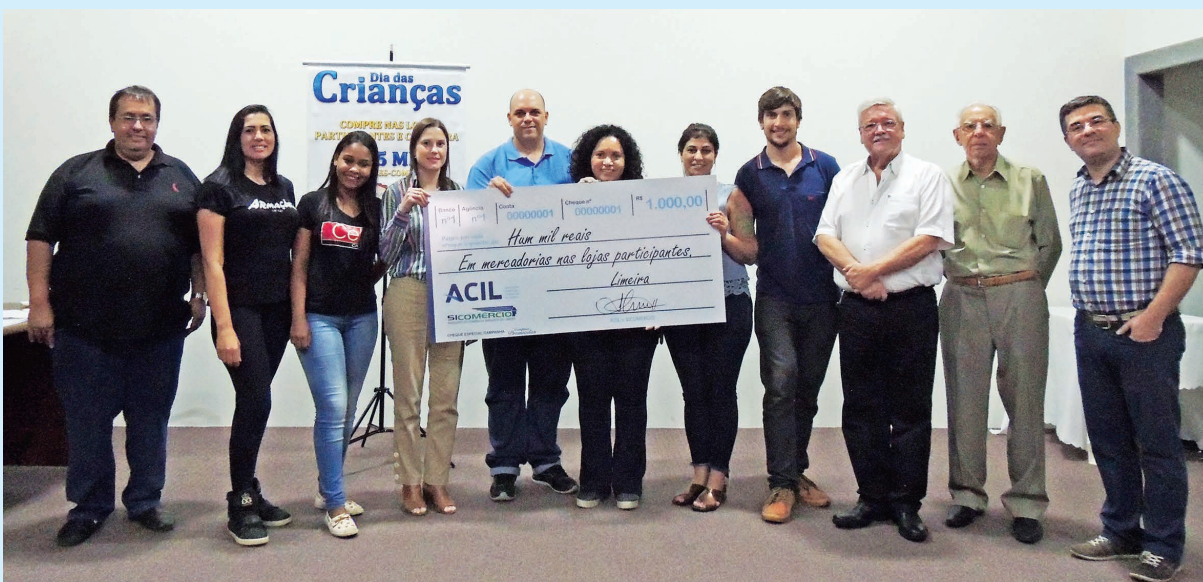
A Campanha Compras Premiadas visa incentivar o consumidor a realizar suas compras em Limeira, com o sorteio de vales-compra durante o ano e um carro zero km no Natal