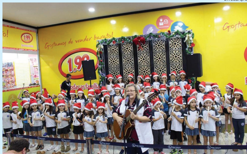
As apresentações seguirão até dezembro com outras instituições educacionais da cidade