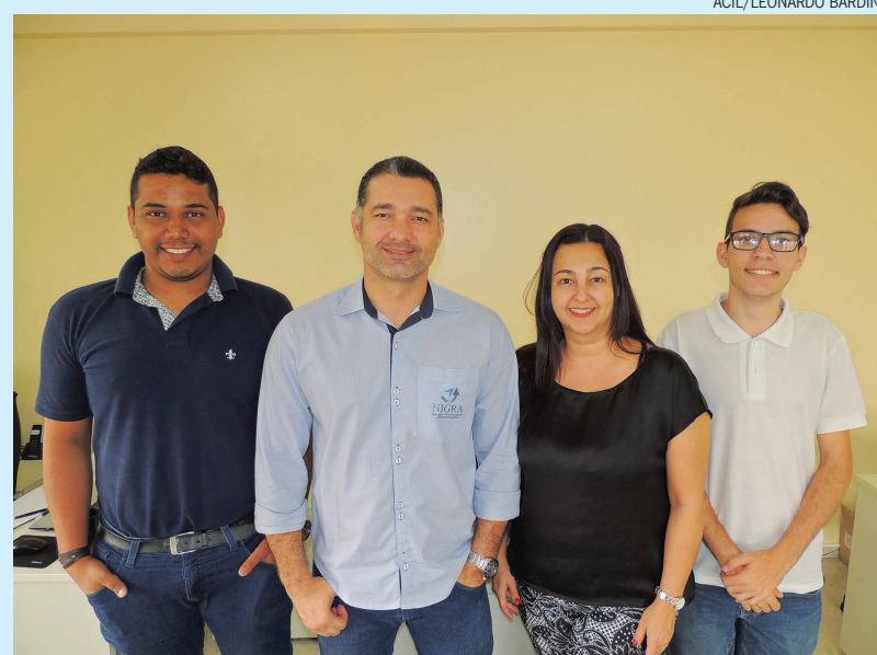
A equipe da NIGRA oferece serviço especializado em vendas, seja parcial ou total de uma equipe

A NIGRA Terceirização de Vendas convida a todos para conhecerem seu trabalho. A empresa está localizada na Rua Alferes Franco, 216 no 4º andar do edifício Vector Center, no Centro. O horário de funcionamento é das 7h30 às 17h30. Mais informações podem ser obtidas pelo telefone (19) 3441-3041 ou e-mail: nigra.vendas@gmail.com.