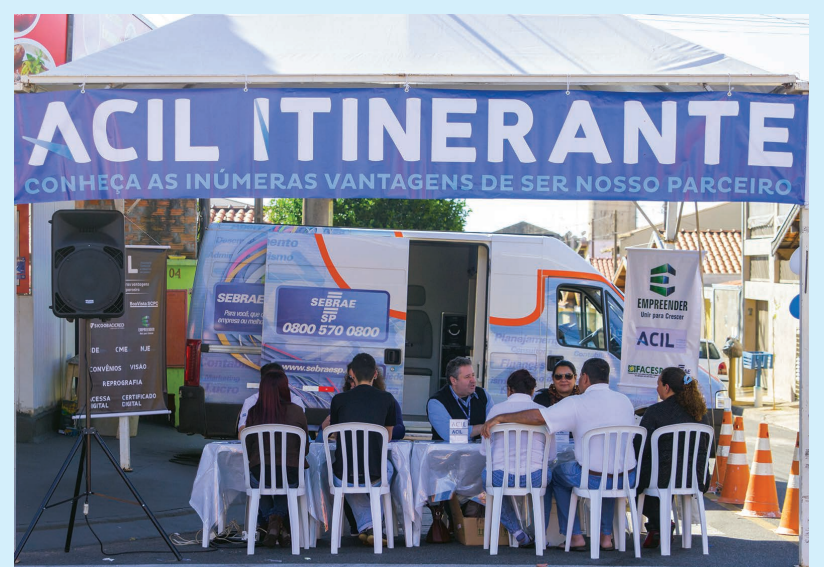
O ACIL Itinerante é uma das ações promovidas pela entidade a fim de levar conhecimento e informações aos empresários dos bairros